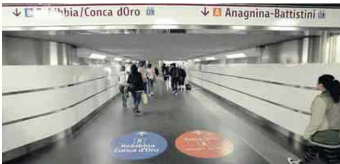
Le nuove gallerie della stazioni Termini: tre le novità, cinque ascensori e 18 scali mobili