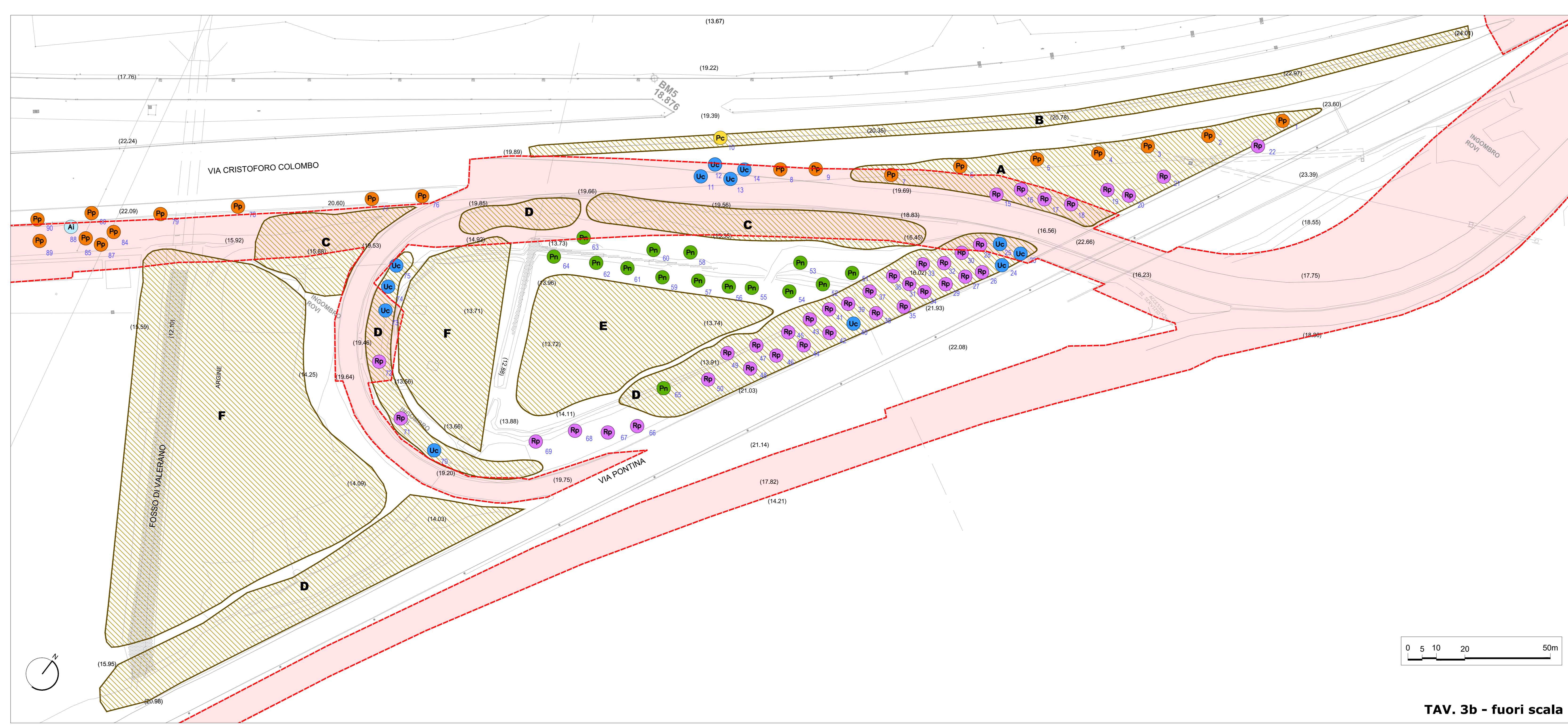
0 5 10 20 50m