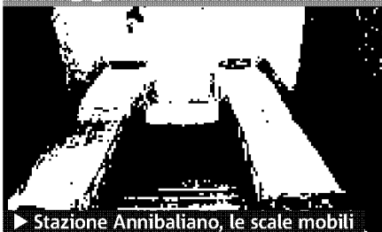
► Stazione Annibaliano, le scale mobili