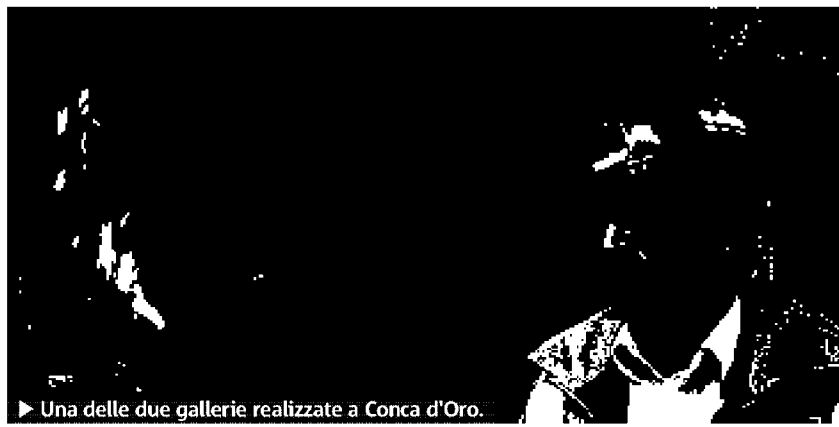
► Una delle due gallerie realizzate a Conca d'Oro.

tracciato - 6 km, 3 fermate con un bacino di utenza di 500 mila persone - per verificare lo stato dell'arte. Si inizia a Conca d'Oro, dove scendiamo giù di 30 metri nella buca della stazione. Il colpo d'occhio è impressionante: nelle gallerie, dove si lavora h24 dalla primavera 2008, mancano solo i binari. A piedi, percorriamo centinaia di metri, passando sotto l'Aniene e sotto l'Alta Velocità. Proseguiamo nelle stazioni Gondar (su viale Libia) e Annibaliano, dove perfino le scale mobili sono già montate. Il fine corsa è a piazza Bologna: dall'alto si vede la talpa Tbm, che ha completato lo scavo, in fase di smontaggio. I bambini del quartiere la conoscono ormai come "talpa salvatrafico". SERENA BOURNENS