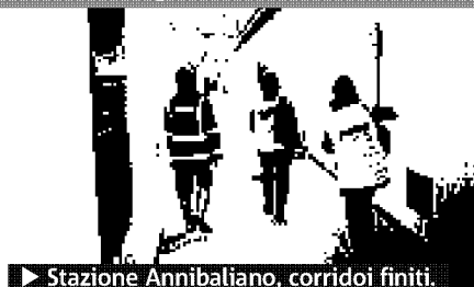
► Stazione Annibaliano, corridoi finiti.