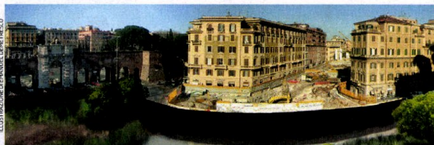
ILLUSTRAZIONE DI EMANUELE DEMETRESCU

Quella per i lavori della linea C è la più vasta campagna di scavi degli ultimi dodici anni, non solo la più estesa, ma anche la più profonda: nel caso >>>