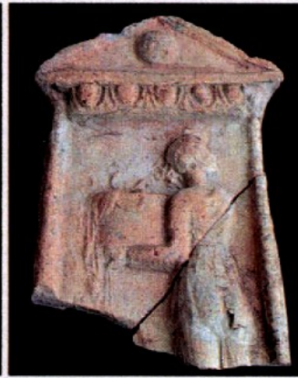
TRE ANTEFISSE DEL I SECOLO DOPO CRISTO RITROVATE NEL CANTIERE DELLA METRO C. PORTANO IMPRESSA LA SIGLA TL. LA STESSA RITROVATA SU TUBATURE DI TERRACOTTA E ANFORE, DA RIFERIRSI FORSE A UN PRODUTTORE LOCALE DI CERAMICA