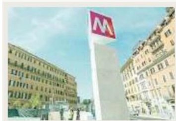
La fermata a San Giovanni